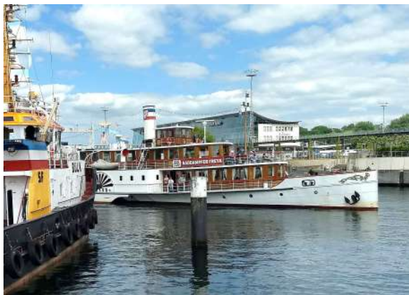
Raddampfer Freya in Kiel

Leinen los in Kiel zum Herbststörn besonderer Art: mit dem historischen Adler-Raddampfer Freya legen wir ab zur so stimmungs- wie geschmackvollen dreistündigen Rundfahrt in der Kieler Förde, die eine kontrastreiche Landschaft aus gemütlicher Perspektive erfahrbar macht. Das leibliche Wohl an Bord garantiert ein opulentes Brunchbuffet plus nachträglich traditionell zum Martinstag am 11. November offerierter Martinsgans. Ca. 7.00 bis 18.00 Uhr / € 83.- inklusive Schiffsrundfahrt ab/an Kiel und Brunchbuffet mit Martinsgans an Bord