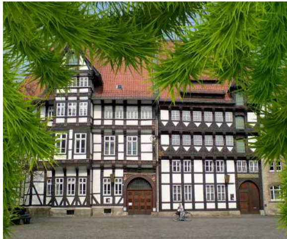
Am Braunschweiger Burgplatz

Ca. 9.00 bis 17.45 Uhr / Fahrpreis: € 35.-