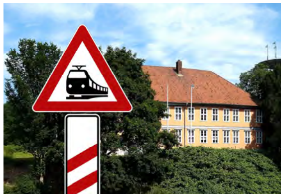
Mit dem Heide-Express zum Biosphaerium Bleckede

Gültig ab 1. Juni 2021 vorbehaltlich laufender Aktualisierungen gemäß relevanter gesetzl. Verordnungen.