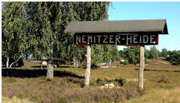
Junge Heide-Landschaft im alten Wendland