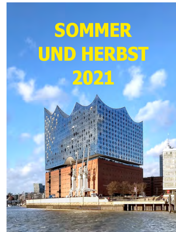
Elbe-Törn nach Hamburg